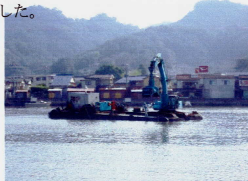
「おしぐらんど」も安心

金浦湾の海底は、年々堆積土により、浅くなっています。県に対し毎年改善を求め、やっとしゅんせつして頂きました。