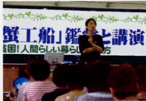
湯浅誠さんの『貧困と人間の尊厳』のお話に熱い想いを共有