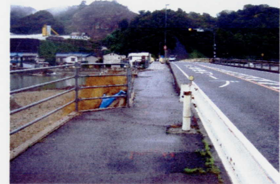
これで相手が通り過ぎるのを待たなくて済みます。

金浦橋西の歩道、急に狭くなっており、すれ違うのも、追い越すのも危険です。昨年度国交省玉島維持出張所に地盤沈下の改修と拡幅の要望をしておりましたが、やっと今年10月からの着工が実現しました。また、警察との協議のもと、国道に新たな横断歩道ができることになりました。完成まで3~4ヶ月かかるとのことでした。