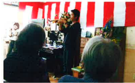
「ええ音じゃなー」 島の大運動会