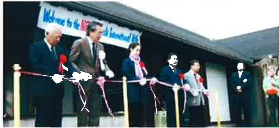
(フランス人ビジターとテープカット)